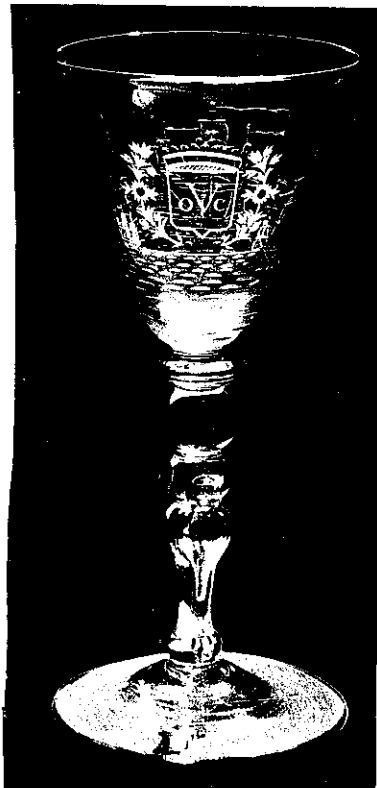
▲ Het VOC-wapen op dit glas wordt omringd door een bloemenkrans en een kroon.